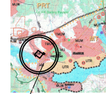
WYRYS ZE STUDIUM UWARUNKOWAŃ I KIERUNKÓW ZAGOSPODAROWANIA PRZESTRZENNEGO GMINY GIETRZWAŁD